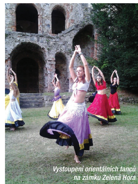
Vystoupení orientálních tanců na zámku Zelená Hora

Oproti fyzickým aktivitám, které jsem až do té doby poznala, dává orientální tanec možnost zapojit do tance nejen břišní svalstvo, ale též záda a paže. Díky přirozeným, avšak pro mnohé nezvyklým pohybům jsem se naučila pracovat s jednotlivými částmi těla a zvedla si nejen fyzickou, ale též sebevědomí.