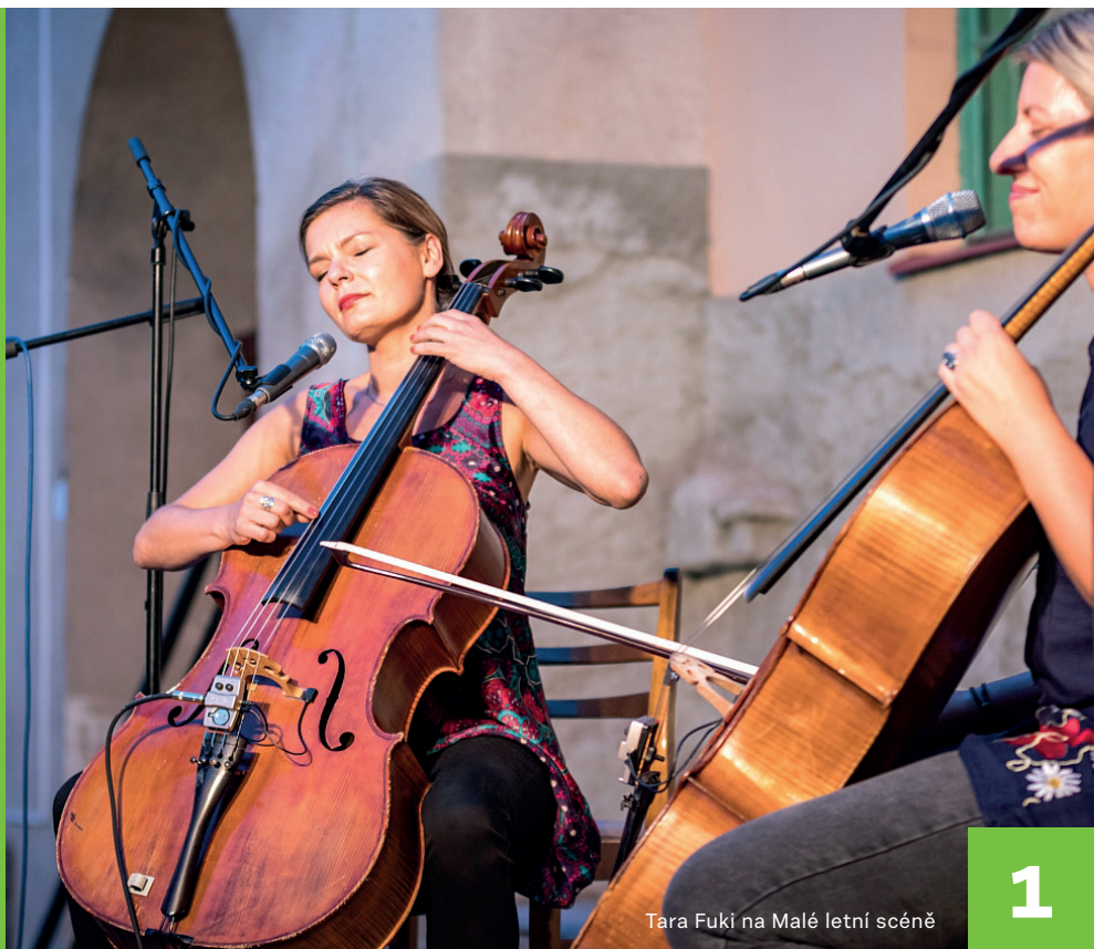
Tara Fuki na Malé letní scéně